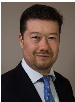
Tomio Okamura – předseda SPD