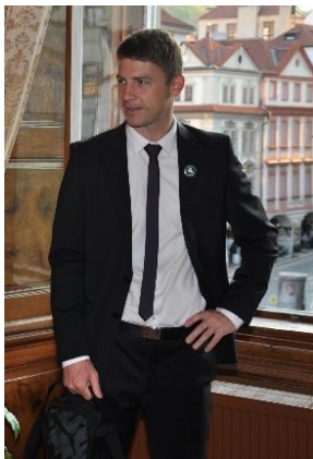
Ing. Petr Mach, Ph.D.,

Ekonom, bývalý poslanec Evropského parlamentu